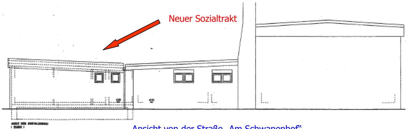
Ansicht von der Straße „Am Schwanenhof“